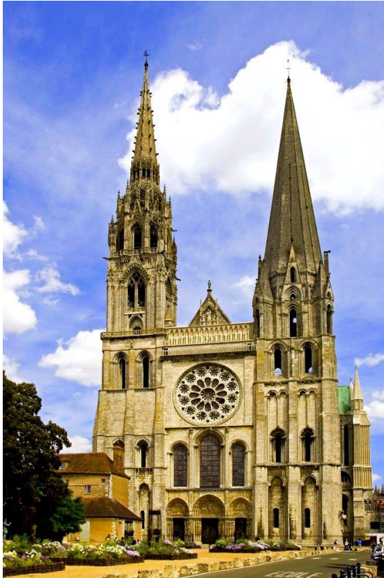
Собор в Шартре